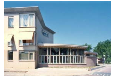
Rechts & onder: De nieuwe grootkeuken van Voor Anker: exterieur en interieur

Bijzondere functies zoals de grootkeuken, de recreatiezaal en de multifunctionele zaal hebben expressieve en extroverte vormen, verzelfstandigd van de overige bouwdelen waar wonen en werken meer introvert van aard zijn.